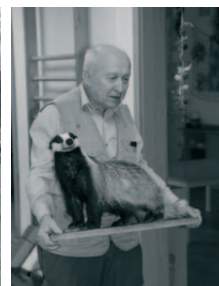
Senioři dětem - Zvířata v lese