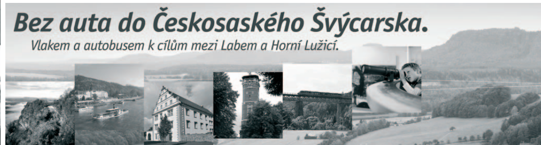
Polep autobusu v rámci marketingové kampaně projektu Bez auta do ČŠ