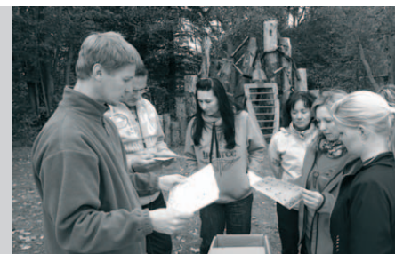
Kurz pro pedagogy - Zoologie jako zážitek