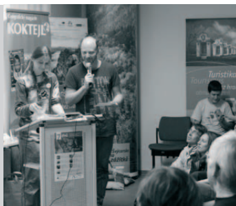
6. ročník cestovatelského festivalu Sedm divů