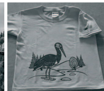
Nová trička s motivem fauny NP