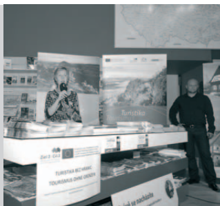
Tisková konference na Staroměstském náměstí