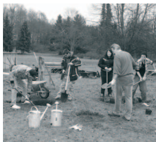
Dotváření areálu broukoviště