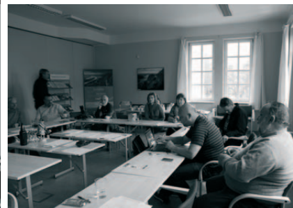
Certifikace regionálních výrobků