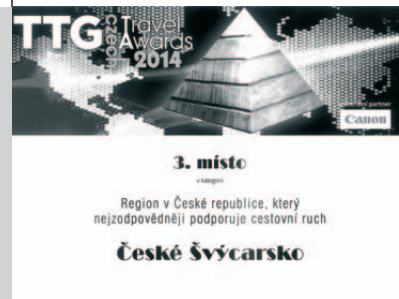
Ocenění TTG Awards