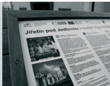
Infopult z projektu THETRIS v Jiřetíně pod Jedlovou