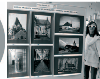
Výstava 3D fotografií v DČŠ