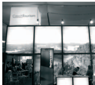
Veletrh CR v Bratislavě