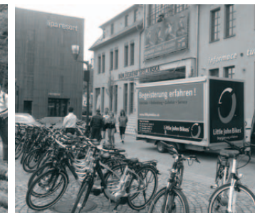
OTS - na elektrokolech k sousedům