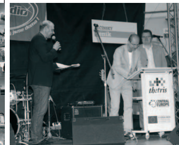
Slavnostní podpis závažku podpory regionálního plánu udržitelnosti projektu THETRIS