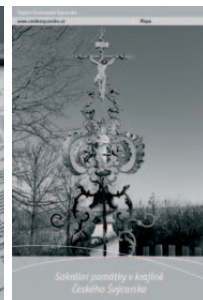
Mapa sakrálních památek v krajině ČS