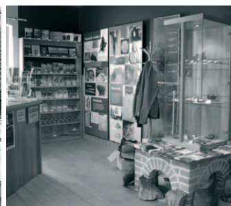
IS Saula - interiér