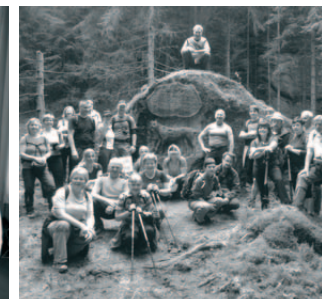
OTS - dálkový pochod k Rysímu kameni