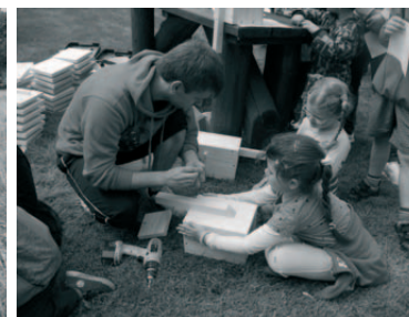
Stavění ptačích budek