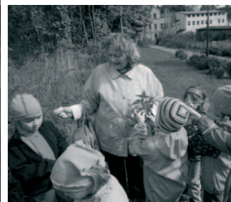
Senioři dětem - Léčivé bylinky ČS