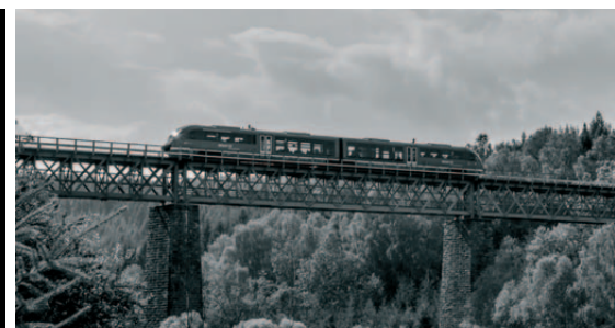
Dráha národního parku