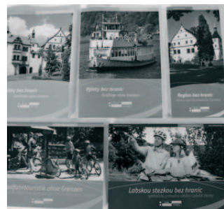
Tiskoviny z projektu Turistika bez hranic